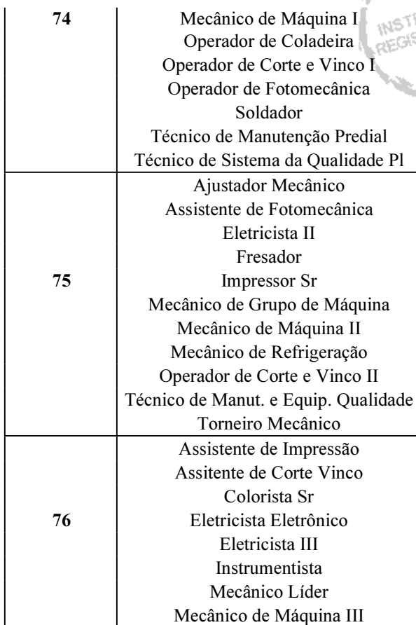
TABELA SALARIAL LOGÍSTICA