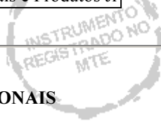
TABELA DE CARGOS SCS - OPERACIONAIS